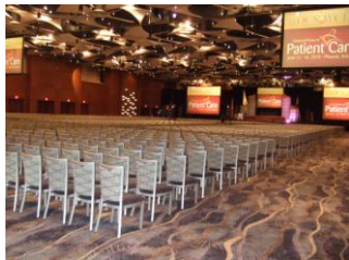
7 jättestora bildskärmar i kongresshallen

Det är alltid lika fint och spännande att få vara med om en kongress invigning. Vi var ungefär 2500 sjuksköterskor från 41 länder med inriktning på stomi, sår och inkontinesvård som samlats i en fantastisk stor kongress hall.