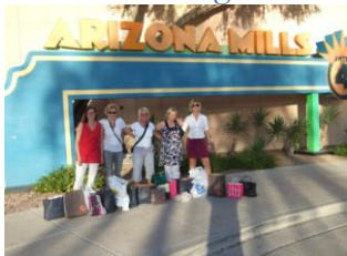
Så här såg det ut när vi var klara

Efter kongressen avslutningsceremoni tog vi en taxi ut till Arizona Mills ett jättestort shoppingcentra, på några timmar handlade vi för fullt, märkeskläder, skor och presenter. Det var en rolig stund